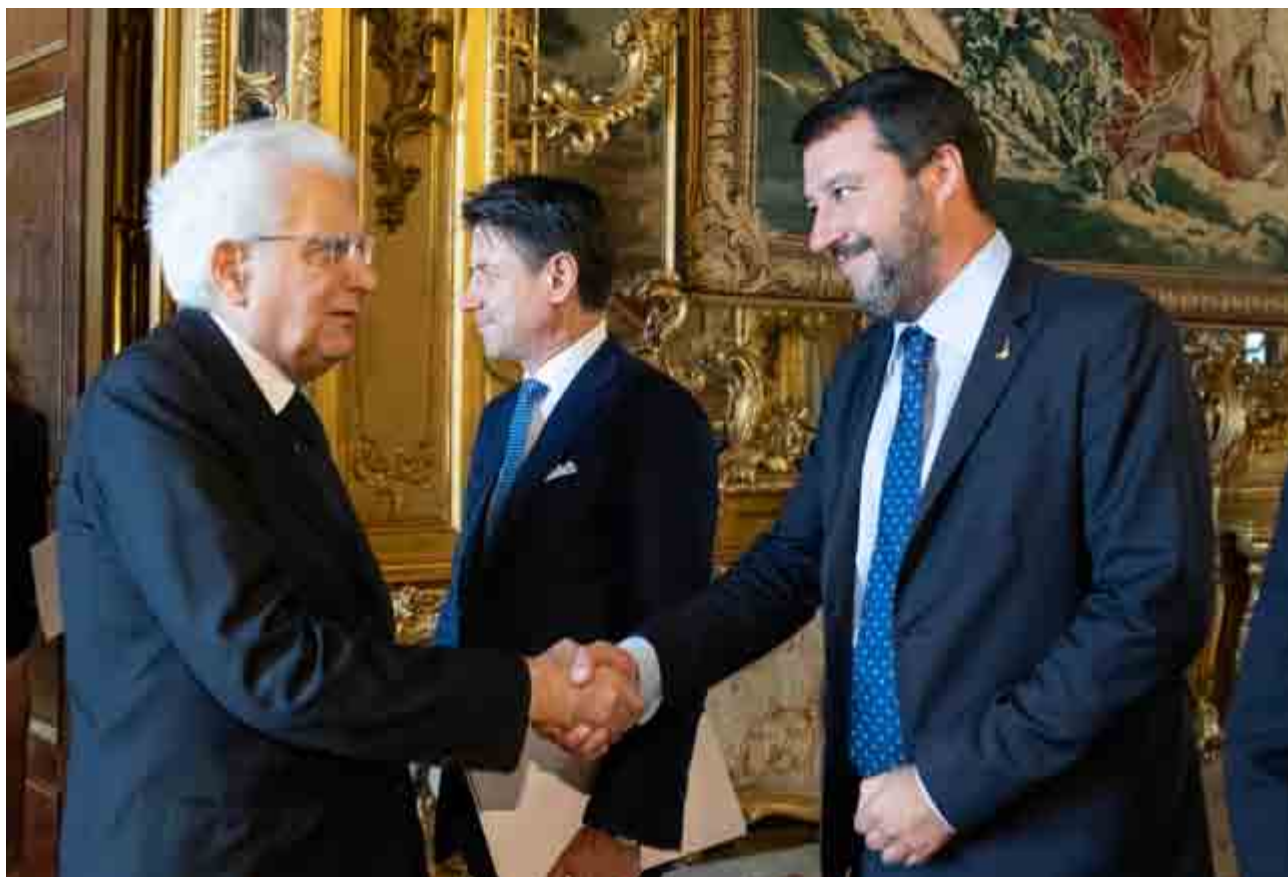
Il presidente Mattarella con Salvini al Quirinale. Dietro di loro il premier Conte

Speriamo non si giustifichi dicendo che è stato troppo occupato dal problema dell'immigrazione.