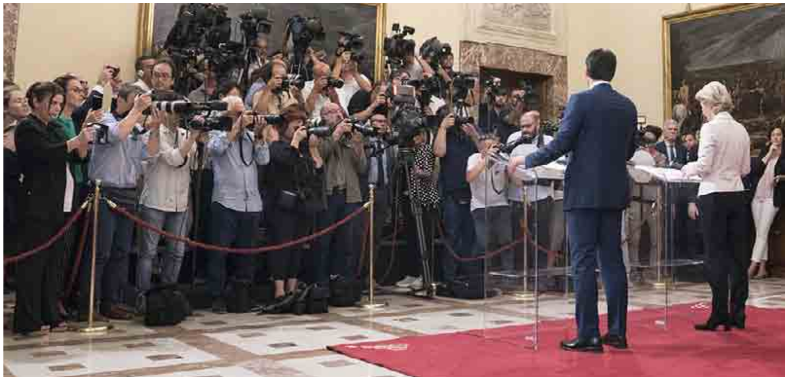
Conte e von der Leyen parlano ai giornalisti in occasione della visita del 2 agosto della neo-Presidente della Commissione Ue a Palazzo Chigi