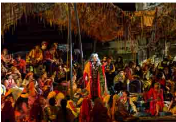
Una scena de "Il Trovatore"

Almeno una volta nella vita si dovrebbe andare ad assistere ad un'opera all'Arena di Verona. Una splendida città europea, della splendida Italia. E quelli della Traviata e del Trovatore 2019 sono due eccellenti occasioni che non dovrebbero perdersi.