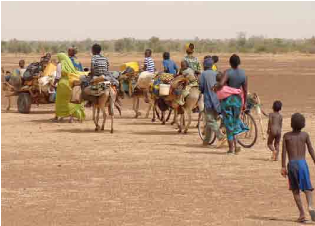
Il fenomeno delle migrazioni sarà un'emergenza per parecchi anni ancora

L'Unione europea verserà alla Turchia altri 1,41 miliardi come contributo per i centri di accoglienza istituiti nel Paese in cui vengono ospitati rifugiati, principalmente siriani, in fuga dalla guerra. Questi soldi serviranno a finanziare principalmente programmi che si concentreranno sulle aree di salute, protezione, sostegno socio-economico e infrastrutture municipali. Le nuove misure fanno parte della seconda "tranche" del Fondo per i rifugiati in Turchia, portando l'importo totale già stanziato a 5,6 miliardi di euro su un totale di 6 miliardi di euro concordati nel 2016, con il saldo rimanente che dovrebbe essere stanziato durante l'estate. Per il commissario per la Politica di vicinato, Johannes Hahn, "con questa nuova dotazione di fondi, l'Unione europea continua a mantenere l'impegno di sostenere la Turchia nell'ospitare il più grande gruppo di rifugiati nel mondo". I