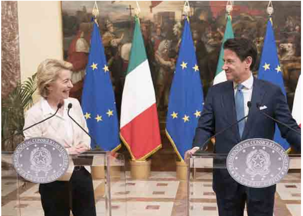
Giuseppe Conte e Ursula von der Leyen il 2 agosto a Palazzo Chigi

Il 2 agosto la futura Presidente (è ancora in carica Juncker) ha incontrato a Roma il primo ministro italiano Giuseppe Conte, in un tempo che sembra reso improvvisamente lontano dalla crisi reclamata dalla