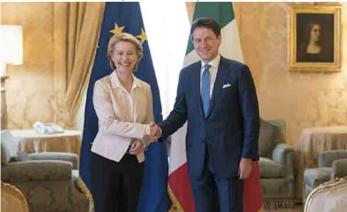
La stretta di mano di rito durante l'incontro di Roma