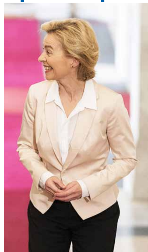
Ursula von der Leyen

È questa la Commissione geopolitica che ho in mente e di cui l'Europa ha urgente bisogno.