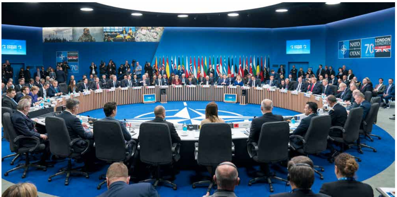
Il vertice Nato a Londra

diffusione di un video con immagini “rubate” durante il ricevimento a Buckingham Palace, dove il premier canadese Justin Trudeau sembra deriderlo (“ha fatto cascare la mascella al suo staff”) con altri leader. Sembra, perché l'audio non è del tutto comprensibile; ma Trudeau ha una ruggine con Trump, che in passato lo insultò pubblicamente. Il video e la polemica che ne segue è una nota di colore che descrive un clima che sembra più influenzato dai linguaggi dei social che dalla prudenza paludata di vecchia scuola. Lascia perplesso come i leader europei, che pure avevano formalmente condannato l'offensiva turca contro i curdi, non siano stati capaci di mettere in difficoltà Erdogan. Questi ha addirittura provato a rilanciare chiedendo - ovviamente invano - che le milizie peshmerga