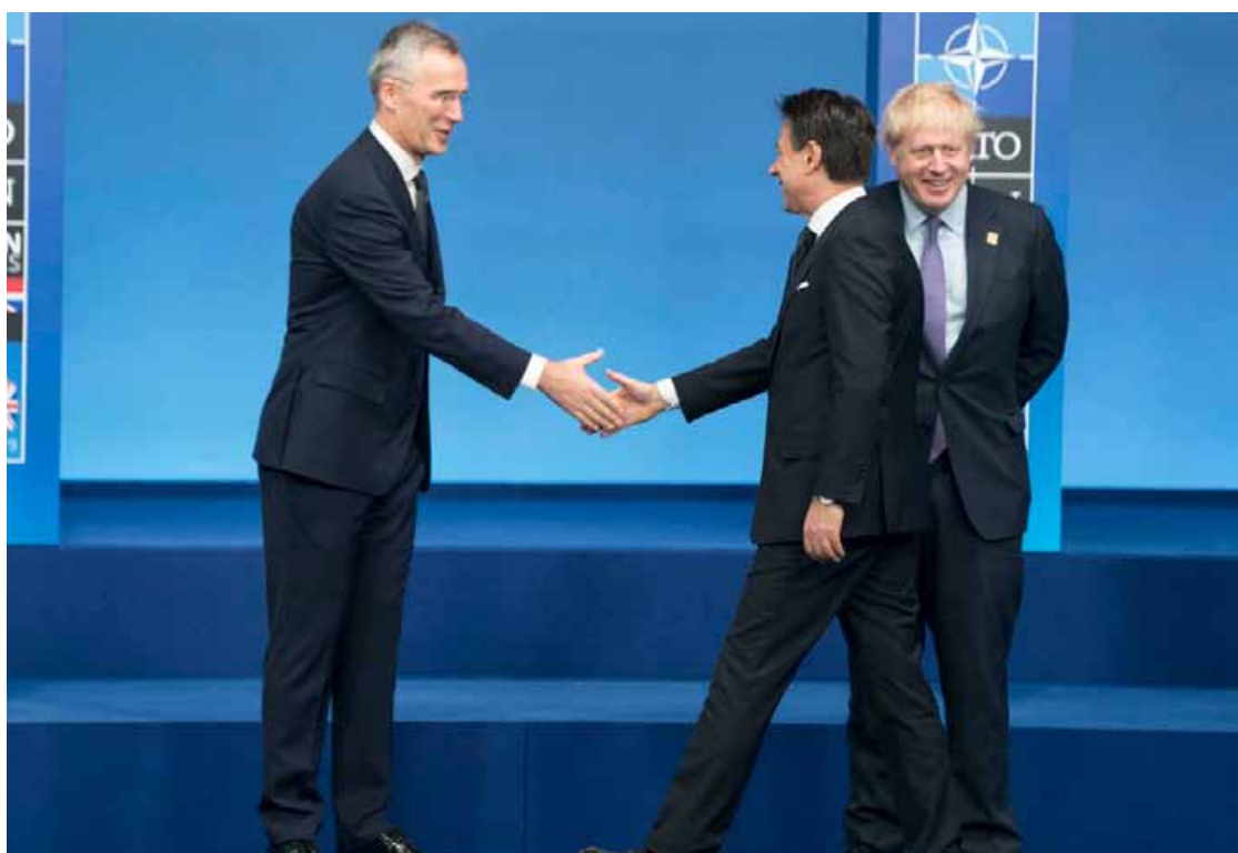
Stoltenberg, segretario generale della Nato, con Conte e Johnson

approccio coraggioso (aiutato forse da quell'arroganza che sono molti a imputargli) non ha una visione fino in fondo europea. Se persegue il sogno di una Difesa dell'Unione, che potrebbe affrancarsi dalla Nato (con la Francia che avrebbe una leadership di fatto, come unica potenza nucleare della Ue senza Gran Bretagna), quando ci sono di mezzo interessi squisitamente francesi non guarda in faccia a nessuno. Meno che mai all'Italia: e lo si è visto, proprio all'immediata vigilia del