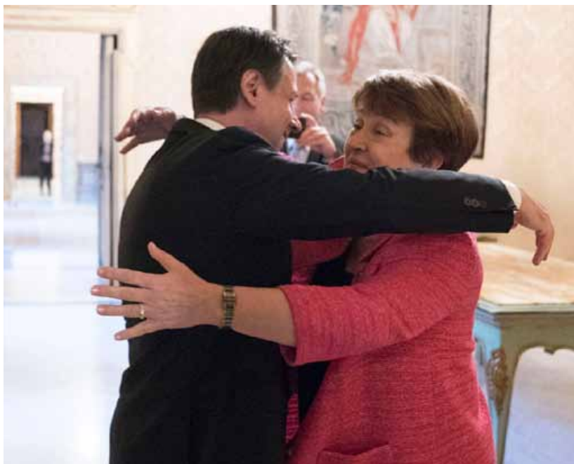
Il premier Conte incontra il 14 dicembre la Direttrice FMI Georgieva a Palazzo Chigi

È ragionevole considerare il debito pubblico dell'Italia in situazione critica. Regling, il "capo" del Mes, in una dichiarazione di qualche