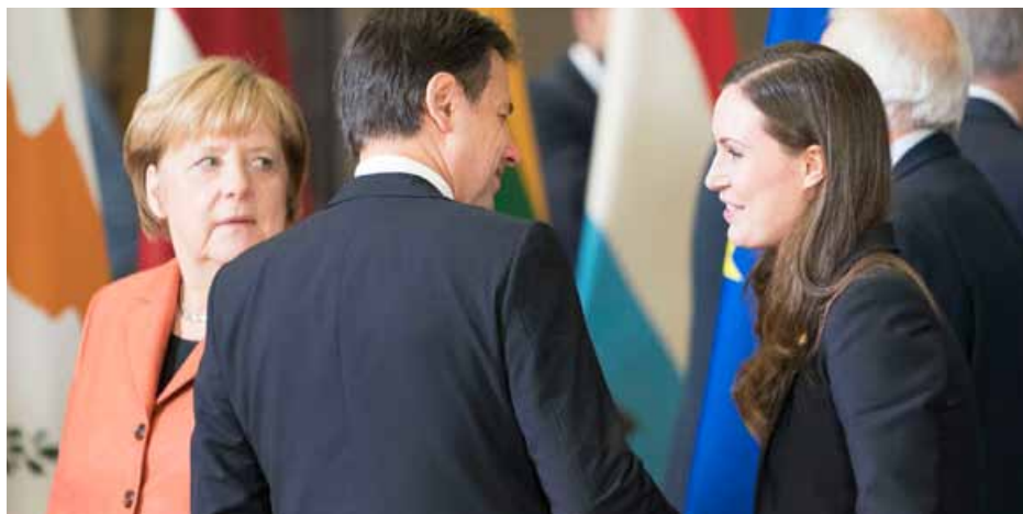
Merkel, Conte e Marin, esordiente a Bruxelles

Sanna Marin si è diplomata e laureata pagandosi gli studi con lavori umili. Nulla è stato facile, ma il suo carattere l'ha distinta, come nella battaglia nel “no” all'ingresso della Finlandia nella Nato e la difesa dei valori pacifisti della sua Nazione. Diceva Charlotte Whitton, prima donna a diventare sindaco di una Capitale, Ottawa (Canada) negli anni Cinquanta: “Una donna deve fare ogni cosa due volte meglio di un uomo per essere considerata brava la metà”. E concludeva, con spirito: “Per fortuna non è difficile”.