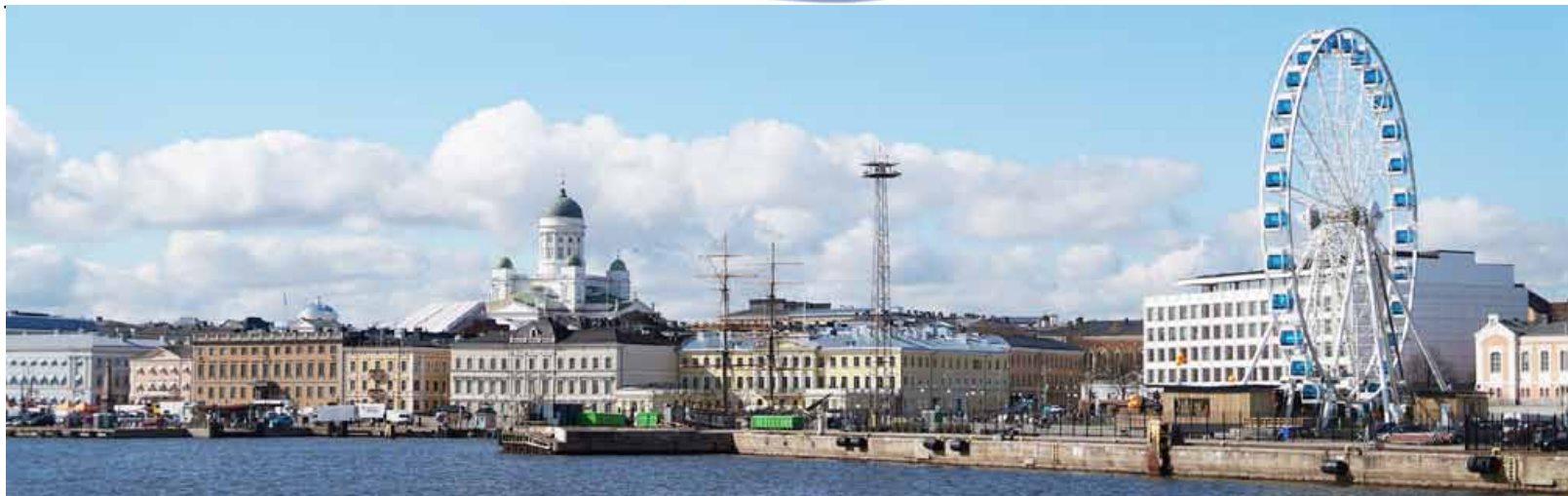
Helsinki, capitale della Finlandia