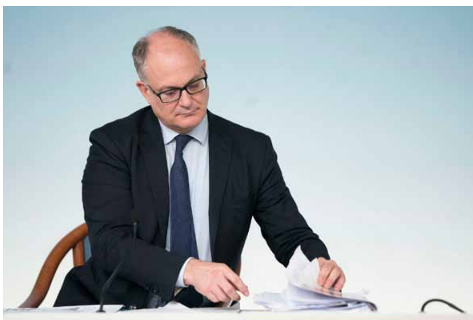
Roberto Gualtieri, ministro dell'Economia

La prima a scatenare il putiferio è stata la Lega di Matteo Salvini, che era al governo con Giuseppe Conte quando si è raggiunto l'accordo tra i partner dell'Eurozona (i 19 Paesi dell'Unione che hanno adottato l'euro come moneta unica). Il leader della Lega parla di accordo "firmato nottetempo" e che non avrebbe rispettato i vincoli approvati in Parlamento da una risoluzione comune delle due forze dell'allora governo, Lega e Cinque Stelle. Ad alzare i toni è anche Giorgia Meloni, presidente di Fratelli d'Italia, ma con molte più ragioni, perché già all'epoca della risoluzione che poneva dei vincoli a Conte sull'accordo, il suo partito si era schierato in modo netto: non ci doveva essere intesa, punto.