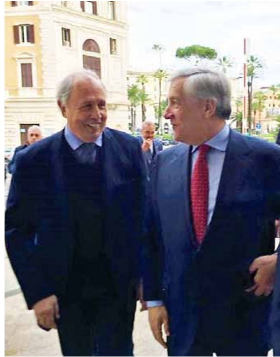
Franz e Tajani al premio Più Europei - i Protagonisti a Roma

In Italia si è passati dai sei milioni di copie vendute al giorno a un milione e mezzo. Le edicole chiudono perché non si vendono più giornali come prima. Molte di esse si riciclano anche a vendere giocattoli e detersivi. Si assiste ad una trasformazione silenziosa che ha colpito in pieno il giornalismo. Mentre all'Inps lo Stato rimborsa i costi per pagare le indennità di disoccupazione non fa lo stesso per l'Inpgi.