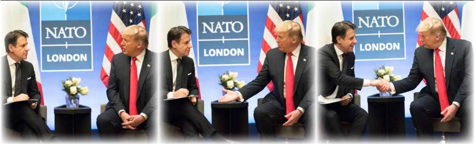
La stretta di mano tra Giuseppe Conte e Donald Trump al vertice Nato di Londra