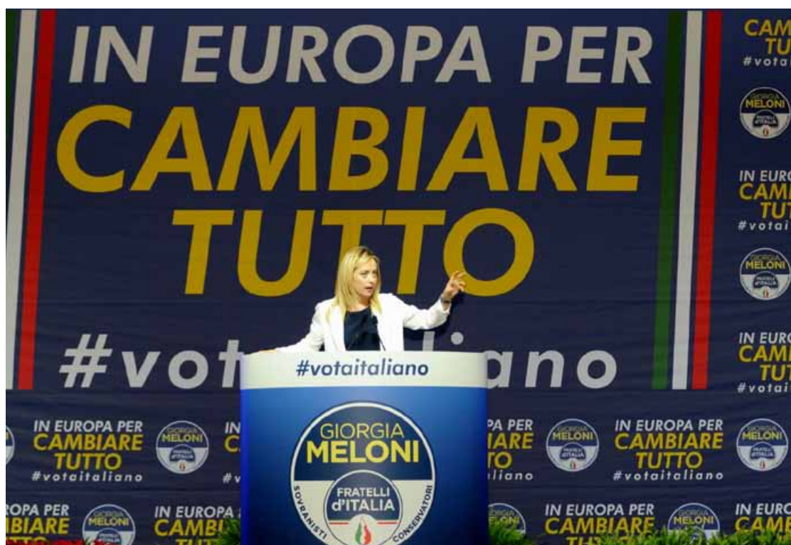
Giorgia Meloni durante un comizio. I Fratelli d'Italia si sono sempre opposti al Fondo Salva/Stati

di un rinvio e di piegarsi ad accettare il Mes. Nel suo programma elettorale alle Politiche del 2018 il Movimento Cinque Stelle aveva assicurato "in particolare" di impegnarsi "a la liquidazione del Fondo "Salva Stati". Il malessere nel movimento però non ha subito danni vistosi, a parte tre senatori che il giorno dopo il voto traslocano tra le file della Lega. Mentre anche dalla Germania, la destra di Alternative für Deutschland contesta il Mes. Ma per tutt'altra ragione: favorirebbe l'Italia.