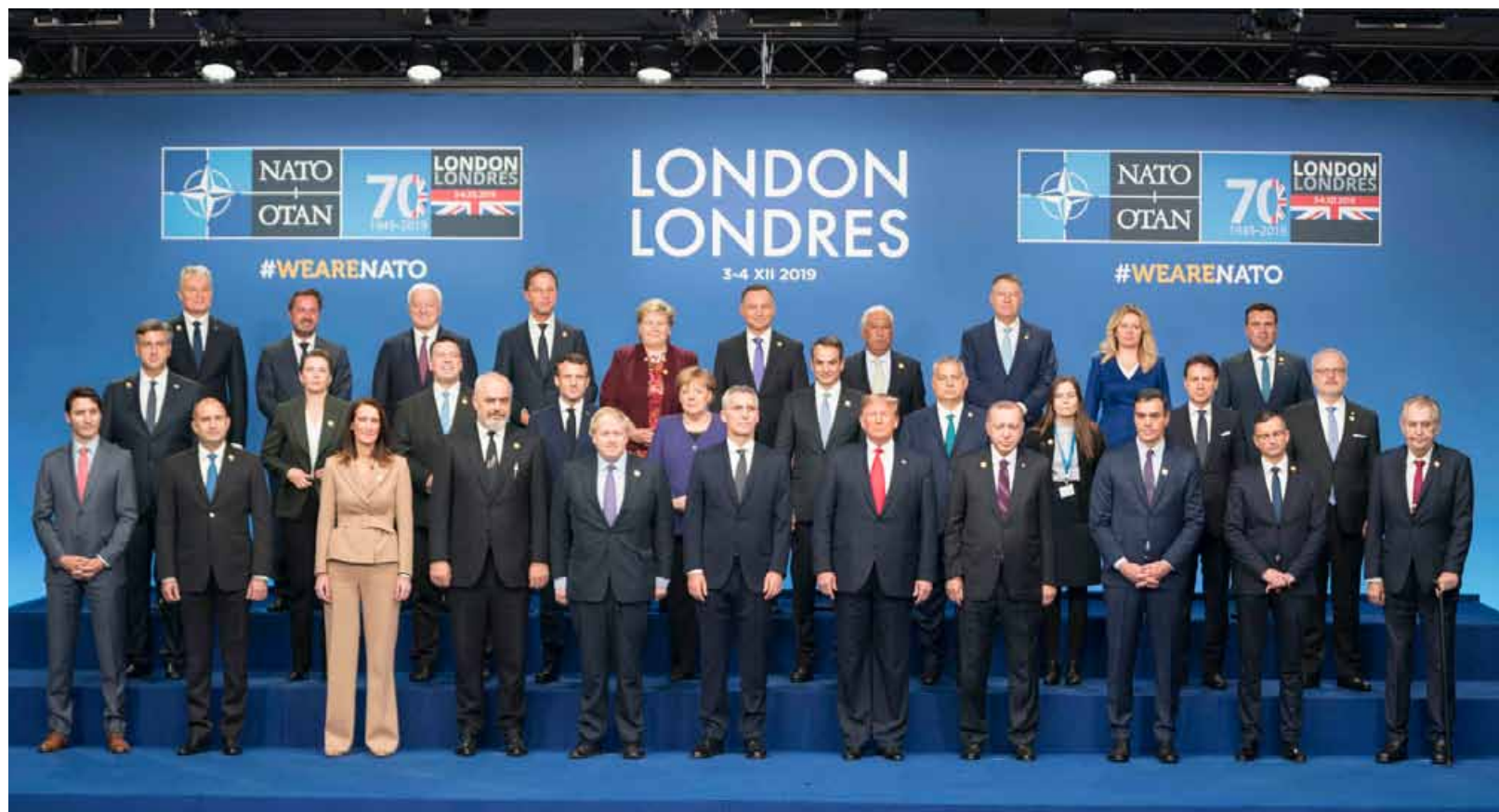
I leader dei 29 Paesi nella foto di gruppo. Al centro, accanto a Trump c'è il presidente turco Erdogan