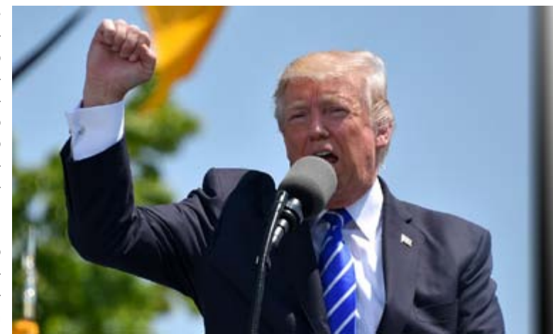
Donald Trump corre per un secondo mandato da Presidente degli Stati Uniti

Il peso della campagna elettorale potrebbe aver influito anche sull'attuale situazione diplomatica, non tanto da parte tedesca quanto da parte americana. Il ritiro di quasi diecimila militari dalla Germania servirebbe a Trump - secondo chi legge le sue decisioni in chiave di politica interna - per raccogliere consensi tra quegli elettori sensibili a un disimpegno militare all'estero, e quindi anche in Europa. Un disimpegno di soldati, non di bombe. Quando alcuni dirigenti del Partito socialdemocratico (escluso però