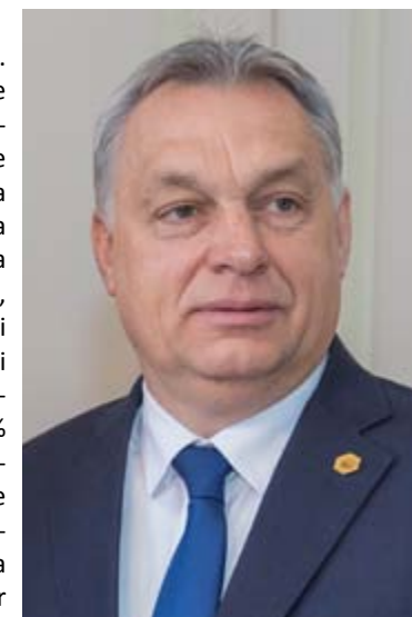
Il premier Viktor Orban

Segreto di Stato. La ferrovia che sostituirà la tratta dalla capitale dell'Ungheria Budapest alla capitale della Serbia Belgrado, costo attorno ai due miliardi di euro, sarà finanziata per l'85% da una banca cinese. Il restante 15% dall'Ungheria. Una ferrovia "protetta" per dieci anni dal segreto di Stato.