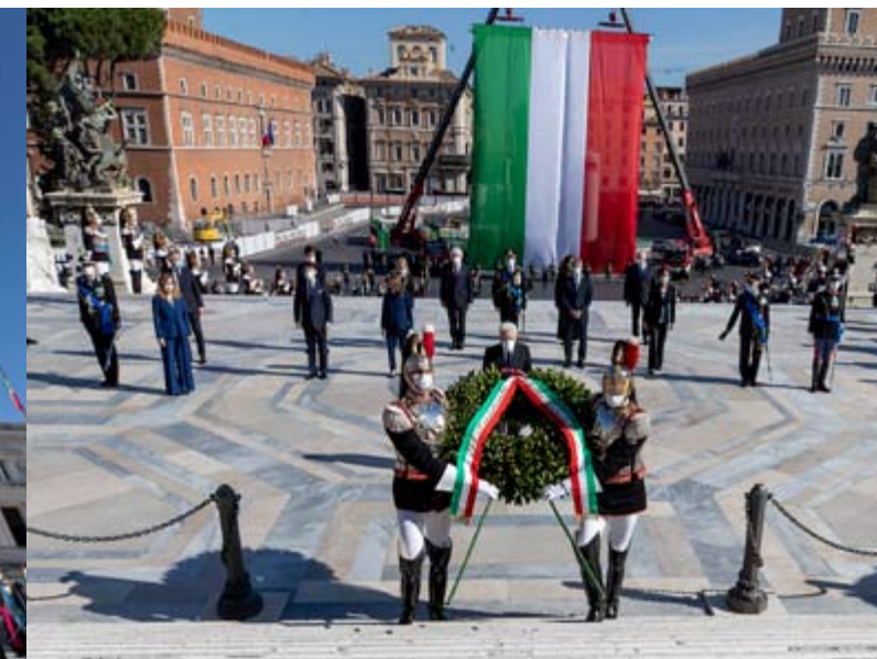
La cerimonia a Piazza Venezia per la festa della Repubblica

Siamo chiamati a scelte impegnative. Non siamo soli. L'Italia non è sola in questa difficile risalita. L'Europa manifesta di aver ritrovato l'autentico spirito della sua integrazione. Si va affermando, sempre più forte, la consapevolezza che la solidarietà tra i Paesi dell'Unione non è una scelta tra le tante ma la sola via possibile