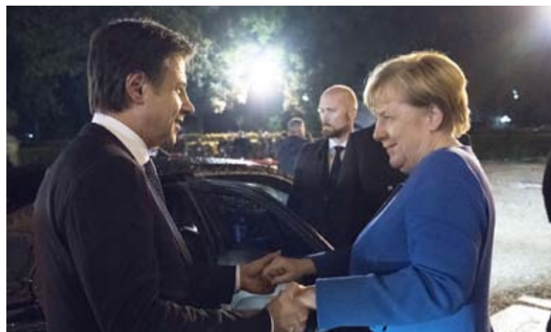
Giuseppe Conte affettuoso con Angela Merkel, l'11 novembre scorso a Roma

Nonostante questo, la cancelliera si è anche data da fare per ammorbidire le tensioni con gli Stati Uniti, anche quelle provocate dagli alleati nell'Unione. Quando lo scorso anno il presidente francese Emmanuel Macron liquidò come morta l'Alleanza atlantica, facendo infuriare Washington, fu Angela Merkel a riconoscere pubblicamente un ruolo