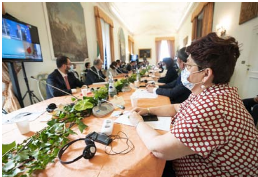
La ministra Teresa Bellanova in primo piano al tavolo degli Stati generali

Una decisione rapida per affrontare la crisi economica, conseguenza della pandemia, il primo ministro Giuseppe Conte l'ha presa, ed è stata quella di convocare gli Stati generali dell'economia, organizzati in un batter d'occhio da Palazzo Chigi. Sono cominciati sabato 13 giugno, con il respiro lungo di una settimana dedicata a "progettiamo il rilancio" (è questo il titolo dell'iniziativa). Con tanta rapidità che neanche il ministro dell'Economia Roberto Gualtieri sarebbe stato avvertito dell'idea cavalcata da Conte, che l'ha annunciata a tutti sembra senza consultarsi prima con i suoi padrini politici di governo, Pd e Cinque Stelle. E tutto questo non aiuta la serenità dell'esecutivo, alle prese con una delle pagine più difficili che si potesse immaginare di affrontare.