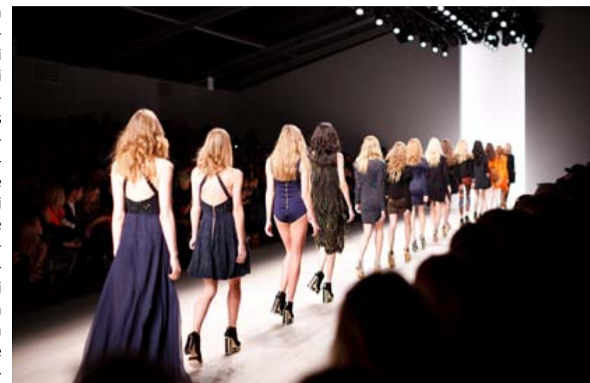
sfilata di moda

Nell'Unione europea, le piattaforme digitali non sono infatti legalmente responsabili dei contenuti caricati dagli utenti. Un principio che vale per le opinioni espresse e che permette, ad esempio, a Twitter di non rispondere di incitamento all'odio ogni volta che suo un utente condivide contenuti violenti contro una determinata categoria di persone. Ma allo stesso tempo si trat-