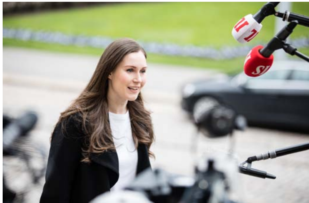
Sanna Marin

negli Stati membri in cinque principali settori strategici, ossia la connettività, le competenze digitali, l'uso di Internet da parte dei singoli, l'integrazione delle tecnologie digitali da parte delle imprese e i servizi pubblici digitali. La connettività è migliorata, ma occorre fare di più per rispondere a esigenze in rapida crescita. Gli Stati membri stanno lavorando al recepimento nel diritto nazionale delle nuove norme dell'UE adottate nel 2018, al fine di promuovere gli investimenti nelle reti ad altissima capacità, sia fisse che mobili. Nel 2019 il 78 % delle famiglie aveva un abbonamento per servizi a banda larga fissa, percentuale in aumento rispetto al 70 % di cinque anni fa, e quasi tutta la popolazione europea è servita dalle reti 4G. Solo 17 Stati membri hanno però già assegnato lo spettro all'interno delle bande pioniere 5G (cinque in più rispetto all'anno scorso). Finlandia, Germania, Ungheria e Italia sono i paesi più avanzati in termini di preparazione al 5G. Il 44 % delle famiglie dell'UE dispone di reti fisse a banda larga ad altissima capacità. Sono necessari ulteriori progressi nel campo delle competenze digitali, soprattutto perché la crisi Covid-19 ha dimostrato che,