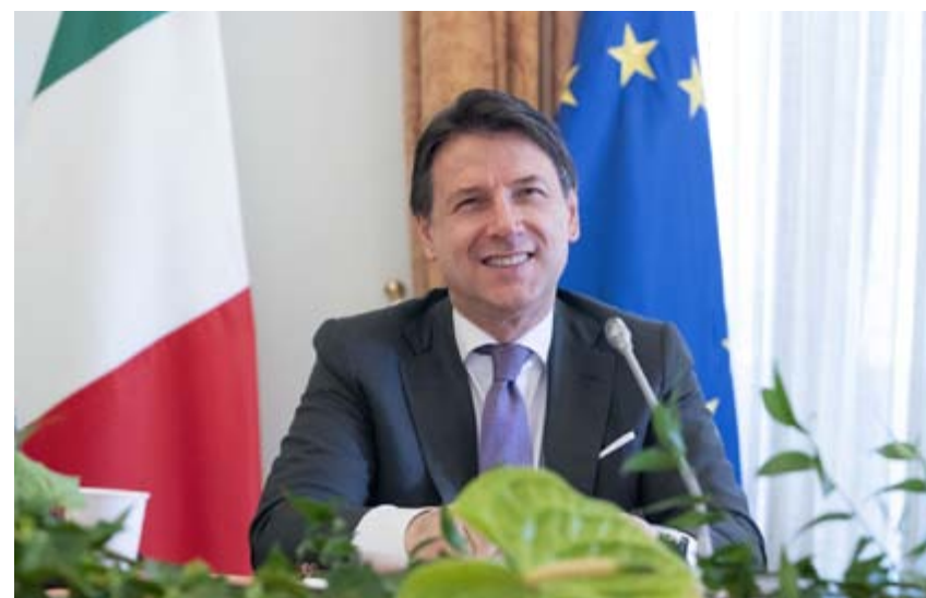
Il premier Giuseppe Conte agli Stati generali

per circostanze irripetibili capo del governo del Paese. Conte è abile, forse prigioniero del suo personaggio, ma più disinteressato di tanti altri che lo circondano e usano la politica per sé.