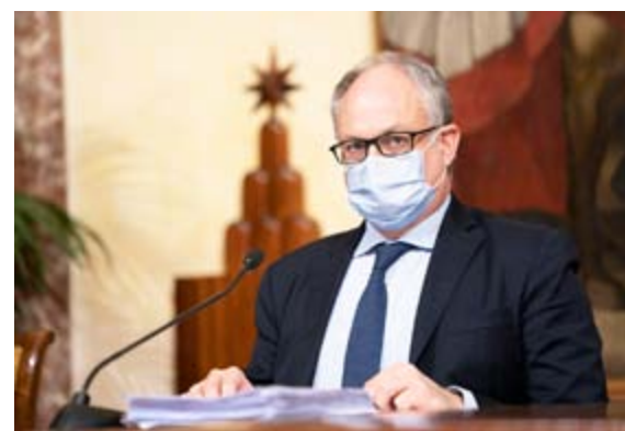
Il ministro italiano dell'Economia, Roberto Gualtieri

158 % Il rapporto italiano debito-Pil previsto dall'Ocse per fine anno Ma con un ritorno dei contagi salirebbe alla cifra disastro del 195%