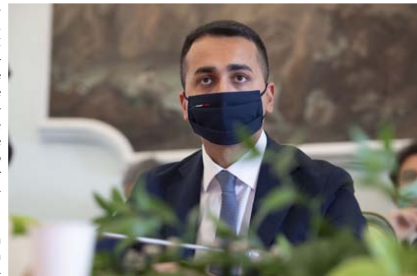
Il ministro degli Esteri Luigi Di Maio agli Stati generali

Per i suoi avversari, la troika Conte se l'è portata in casa. Ma non è neanche così. Un intervento via video non è altro che un messaggio pubblico sul già detto. Sono gli "ospiti stranieri" di un Festival di Sanremo formato politica. Nessuno ha bisogno di una generica lista delle spese delle cose da fare, ma di una strategia su come fare le cose presto e bene. In questo, ha ragione l'opposizione di Conte. Tutto sembra fatto apposta per un trionfo della comunicazione che prenda il posto della concretezza. I giornalisti sono tenuti fuori dalla porta. Comunicazione, non informazione. Ma è anche ingiusto confinare Conte nella cornice di un vanitoso avvocato pugliese diventato