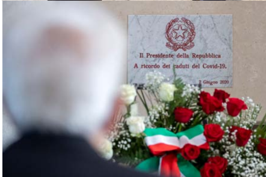
Il Presidente Mattarella a Codogno (Lodi), località simbolo dell'emergenza coronavirus, il 2 giugno

tudini consolidate. Ha costretto a interrompere relazioni sociali, a chiudere le scuole. Ha messo a rischio tanti progetti di vita e di lavoro. Ha posto a durissima prova la struttura produttiva del nostro Paese. Possiamo assumere questa giornata come emblematica per l'inizio della nostra ripartenza. Ho ricevuto e letto, in questi tre mesi, centinaia di messaggi di preoccupazione ma anche di vicinanza, di fiducia, di speranza. Dobbiamo avere piena consapevolezza delle difficoltà che abbiamo di fronte. La risalita non sarà veloce, la ricostruzione sarà impegnativa, per qualche aspetto sofferta. Serviranno coraggio e prudenza. Il coraggio di guardare oltre i limiti dell'emergenza, pensando al futuro e a quel che deve cambiare. E la prudenza per tenere sotto controllo un possibile ritorno del virus, imparando a convivere in sicurezza per il tempo