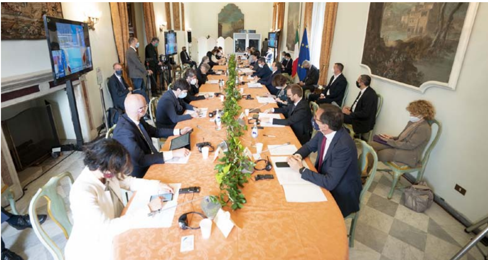
La prima giornata di Stati generali dell'Economia a Roma