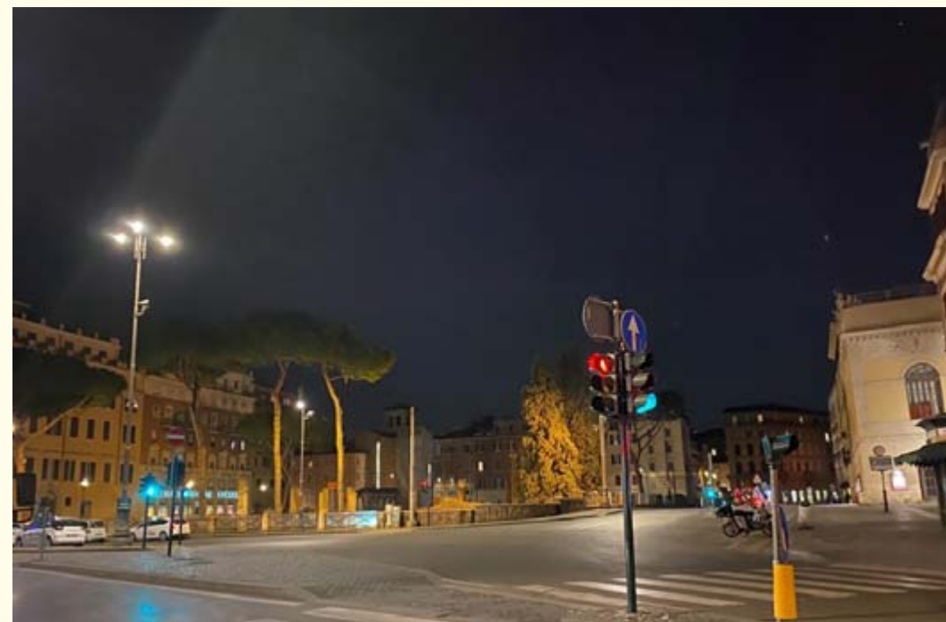
Roma di notte durante il lockdown per l’emergenza sanitaria

effetti negativi gravi sulle economie e sulle società dell’Unione, rende necessario “...un supplemento eccezionale di flessibilità aumentando la possibilità di mobilitare tutto il sostegno inutilizzato dei fondi...”. In tal modo è consentito, agli Stati membri (“in via eccezionale”, una sottolineatura più volte ripetuta) di chiedere che, nel periodo contabile 2020-2021