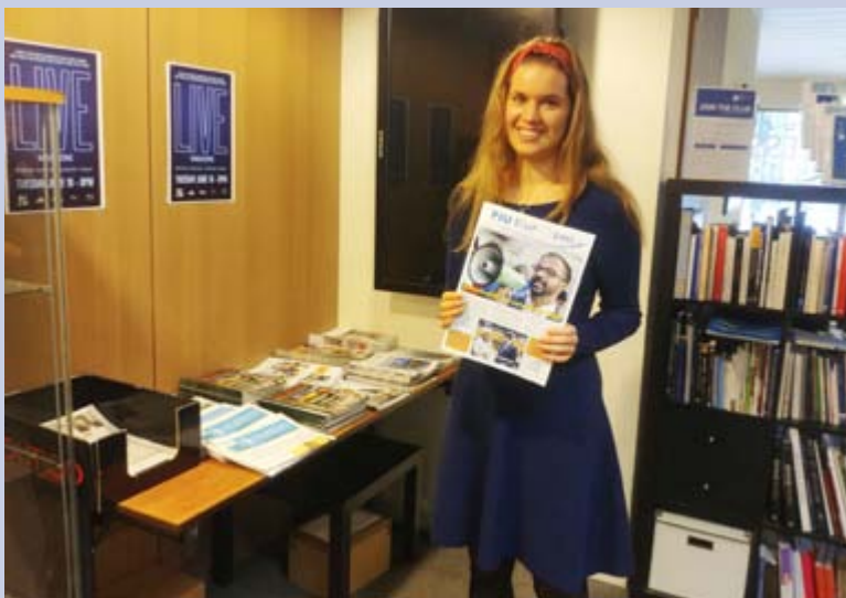
Più Europei al Press Club di Bruxelles

La Commissione ha potenziato la flotta antincendio di RescEU per la stagione estiva