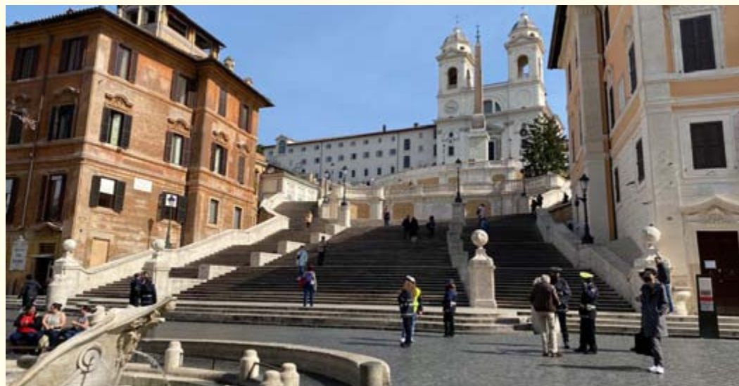
Piazza di Spagna a Roma durante il lockdown

di attuazione per il 2019 e per la trasmissione della relazione di sintesi elaborata dalla commissione su tale base. E' poi previsto un ampliamento della possibilità offerta alle autorità di audit di impiegare un metodo di campionamento non statistico per il periodo contabile 2019-2020, precisandosi che l'ammissibilità delle spese viene autorizzata per le operazioni completate o pienamente realizzate volte a promuovere le capacità di risposta alla crisi anche prima che la commissione approvi la necessaria modifica del programma e con l'individuazione di modalità specifiche per invocare l'epidemia quale causa di forza maggiore