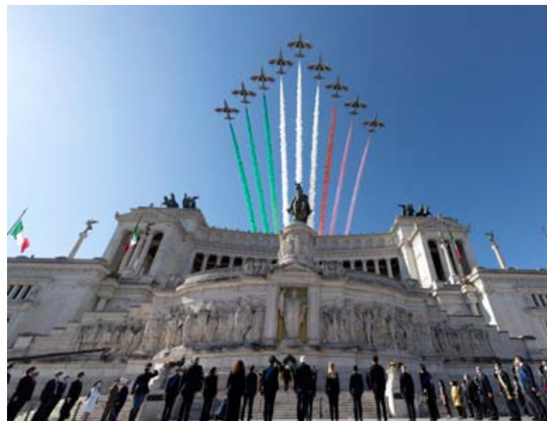
Le Freccie Tricolori celebrano il 2 giugno a Roma

territorio con l'altro. Un ambiente sociale con l'altro. Tutti parte di una stessa storia. Di uno stesso popolo. Mi permetto di invitare, ancora una volta, a trovare le tante ragioni di uno sforzo comune, che non attenua le differenze di posizione politica né la diversità dei ruoli istituzionali. Siamo tutti chiamati a un impegno comune contro un gravissimo pericolo che ha investito la nostra Italia sul piano della salute, economico e sociale.