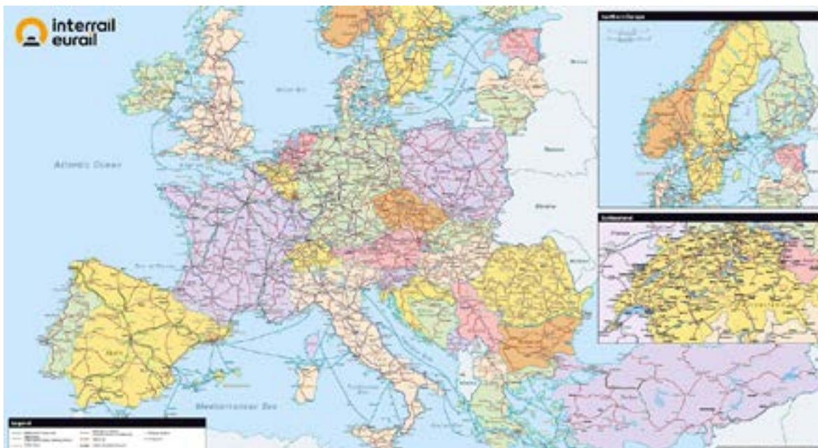
La rete Interrail, da Trenitalia

Per i giovani, e non solo, da tutta Europa, in particolare, è in vigore il programma Interrail: il suo Global Pass parte da 185 euro e si può viaggiare illimitatamente in treno e traghetto in 33 Paesi differenti, per un periodo di viaggio da un minimo di 3 giorni fino a 3 mesi, disponibile per tutte le fasce di età ed i bambini fino a 11 anni possono viaggiare gratuitamente se accompagnati.(gn)