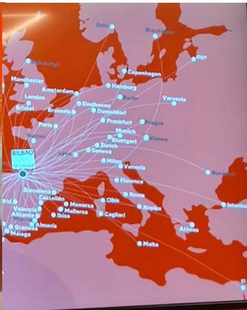
RETE Volotea