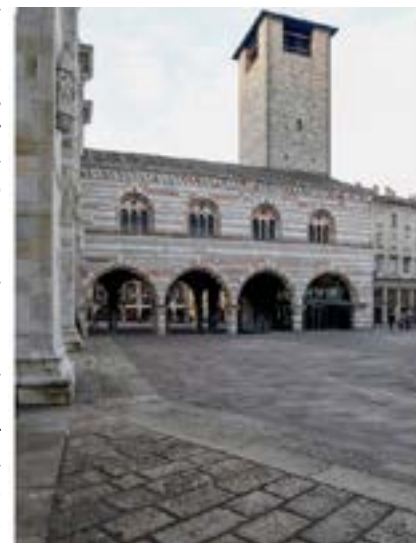
Palazzo del Broletto, Como.