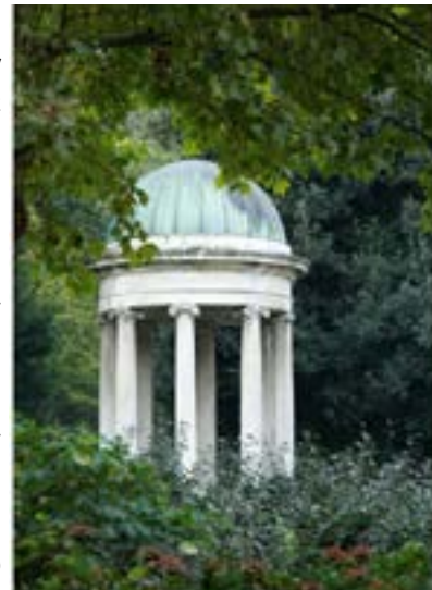
Villa Olmo, Como