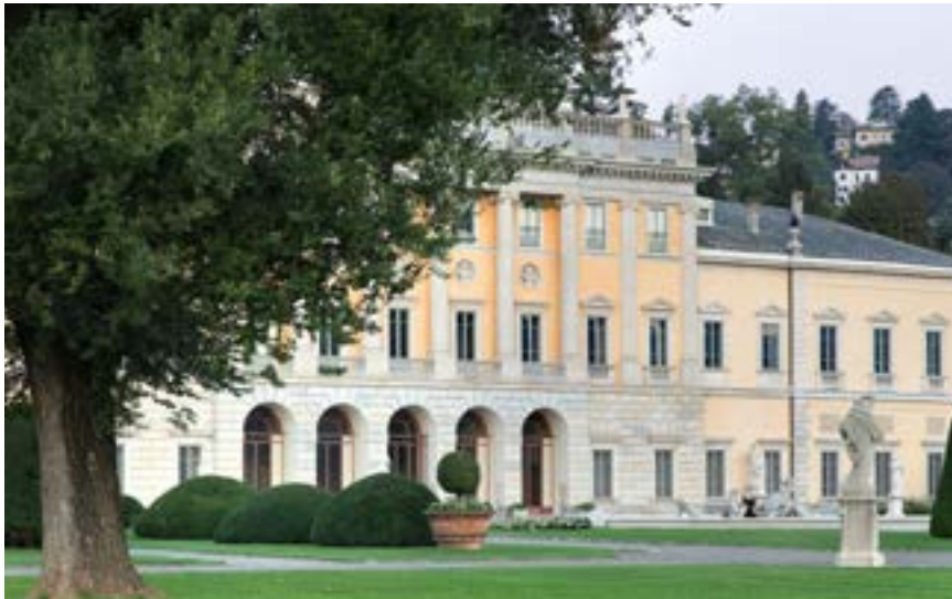
Villa Olmo, Como

Nato a Genova nel 1957, si è laureato in Storia dell'arte con Corrado Maltese. È stato cronista del "Secolo XIX", inviato speciale del "Lavoro", capo servizio del Venerdì di Repubblica, con cui collabora, e delle pagine culturali milanesi di Repubblica. Ha collaborato con "Epoca", "Arte", "Antiquariato", "L'illustrazione italiana". Ha scritto guide storico artistiche di Genova, Sanremo, Bordighera. Cura due festival culturali: "ZelbioCult, incontri d'autore su quell'altro ramo del lago di Como" e "Il Bello dell'Orrido. Spavento, stupore, meraviglia" a Bellano.