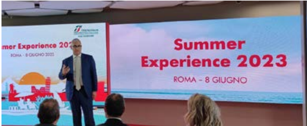
Stefano Cazzilla, Presidente Trenitalia

Salito del 65%, rispetto al 2019, l'acquisto di biglietti dall'estero,